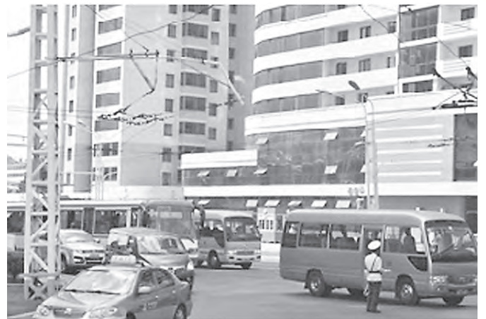
数多くのトロリーバス、バス、タクシーなどが走る平壤市内 (8月9日)