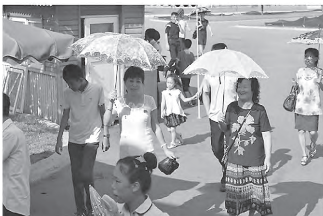
市民プール附近の様子 (8月5日)