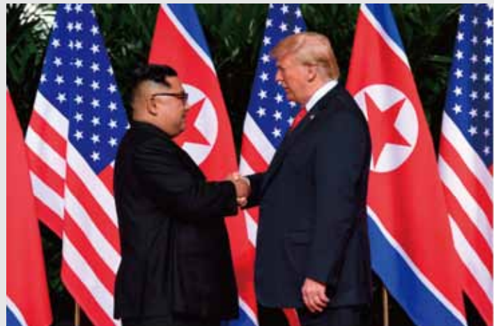
④4・27 南北首脳会談（板門店） ⑤6・12 米朝首脳会談（シンガポール）